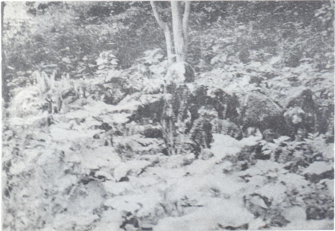
Sitio La Pedregosa Alta (Joyo Caliente), septiembre 1987. Estructuras de piedras cubiertas por vegetación.