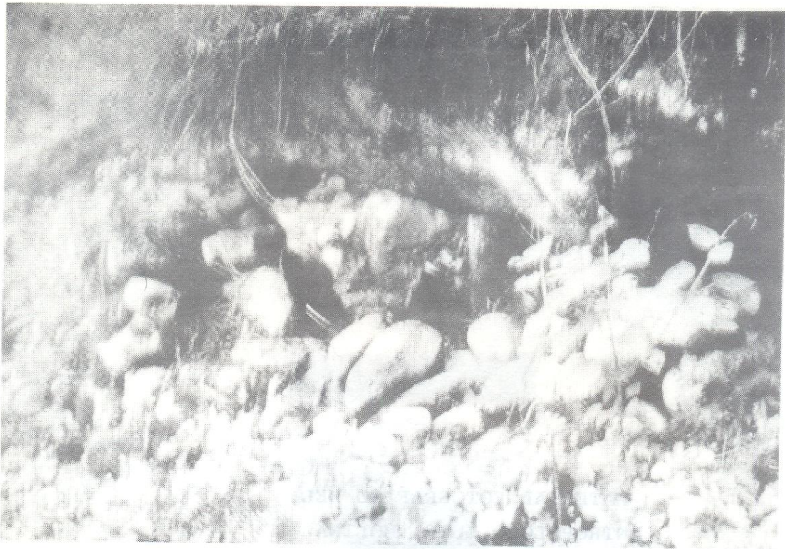
(El sitio de Arqueología de la División de (OAI)

Sitio La Pedregosa Alta Septiembre 1987 Piedra enorme, con murito de piedras. Fotos Mario Sanoja O. Academia Nacional de la