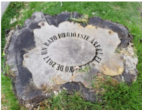
Figura 6. Danilo Estacio.