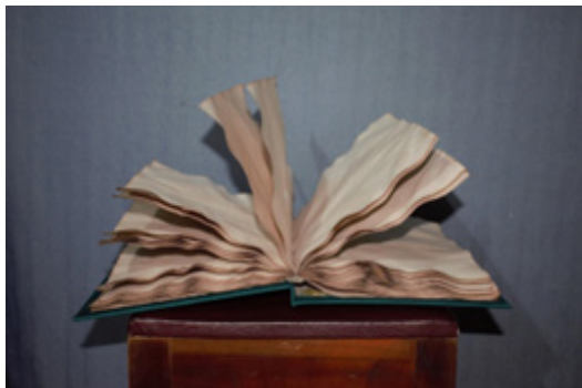
Figura 1. Libia Benavides. "El diario de los sueños". Instalación, 2023

Las concepciones y prácticas de investigación en el contexto de las praxis artísticas abren la frontera de los paradigmas de investigación de las ciencias al cuestionar las dimensiones ontológica, epistemológica, metodológica (Guba y Lincoln, 2002), estética, pedagógica, política, de sus estructuras y la forma en que constituyen las teorías del conocimiento que sustentan los procesos de su producción, reproducción e implementación en contextos culturales diversos a través de la educación artística.